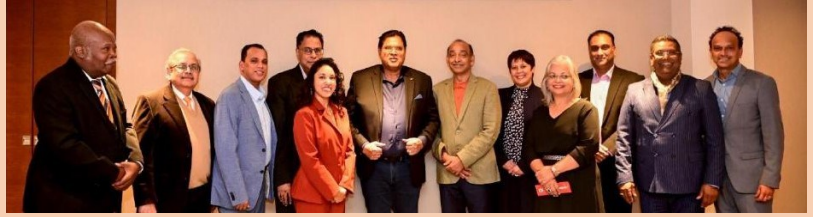
VHP-Nederland en vertegenwoordigers van diaspora-organisaties met de president

Op donderdag 14 november heeft president Santokhi in Den Haag als VHP-voorzitter overleg gevoerd met het dagelijks bestuur (DB) en de kernvoorzitters van VHP Nederland. Tijdens een constructief gesprek zijn afspraken gemaakt om de samenwerking met de VHP te intensiveren en de verkiezingscampagne te ondersteunen. VHP Nederland zal een campagne team samenstellen en deel uitmaken van het Landelijk Campagne Team van de VHP.