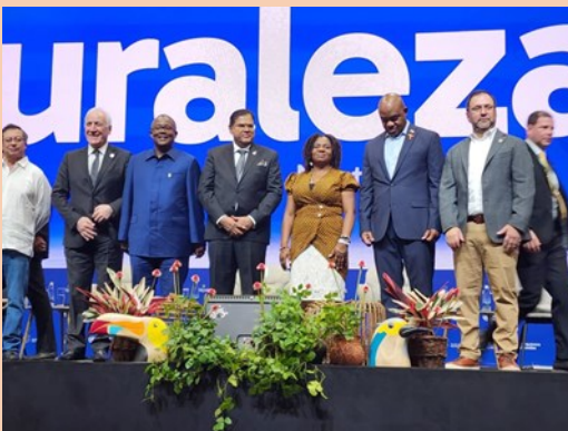
President Chandrikapersad Santokhi in Colombia

Door actief deel te nemen aan de discussies zorgde Santokhi ervoor dat de stem van Suriname werd gehoord bij het vormgeven van de doelstellingen van het bondgenootschap. Dit strategische partnerschap versterkt niet alleen de mondiale klimaatactie, maar onderstreept ook het leiderschap van Suriname bij het bevorderen van een duurzamere toekomst voor iedereen.