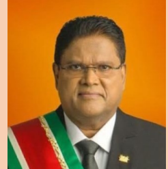
Z.E. Chan Santokhi

Het bestuur van de Vooruitstrevende Hervormings Partij (VHP) vormt het fundament van de partij en staat aan het roer van alle politieke en organisatorische activiteiten. Dit bestuur, bestaande uit 25 leden, wordt elke vijf jaar gekozen door het partijcongres en is verantwoordelijk voor de algehele leiding van de partij.