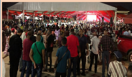
Feesttent te Lelydorp

Op 3 februari 2024 werd ter ere van de 65e verjaardag van VHP-voorzitter Z.E. president Santokhi een zeer geslaagde feestelijke bijeenkomst georganiseerd in zijn woonplaats Lelydorp. De president en zijn echtgenote waren zichtbaar verrast door de enorme opkomst en de geweldige organisatie van deze mooie avond. Duizenden mensen zijn van heinde en verre gekomen om de president te feliciteren en om deelgenoot te kunnen zijn van deze prachtige avond.